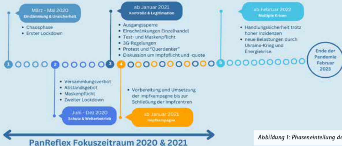
Abbildung 1: Phaseneinteilung der Pandemie